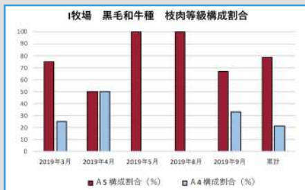
飲用開始 1 年後