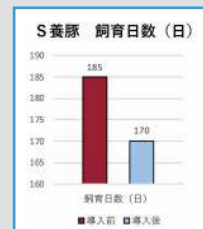
とうもろこし自家配飼料導入開始9ヶ月後